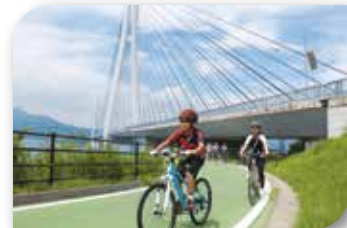
Recorrido en bicicleta

Imabari mantiene un acuerdo de ciudad hermana con Ciudad de Panamá desde 1977. Imabari cuenta con una tecnología de construcción naval de primera clase y también es una zona de piratas en el pasado, por lo que el mar y la historia son sus atractivos. También se pueden degustar platos de marisco fresco y disfrutar del espectacular mar y las islas en el recorrido en bicicleta.