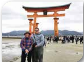
Itsukushima-jinja en Hiroshima