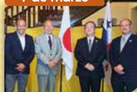
Ceremonia de Reconocimiento del Ministro de Asuntos Exteriores para maestros de Aikido, Buikukai