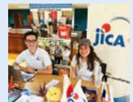
Stand de JICA en el Día de la Cultura Japonesa 2024