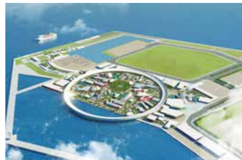
Imagen del lugar de la Expo 2025