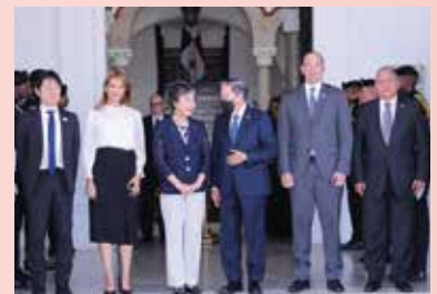
Visita de cortesía de la Ministra Kamikawa al Presidente Cortizo en febrero de 2024

Japón aboga por la iniciativa Mujeres, Paz y Seguridad (WPS, por sus siglas en inglés), basada en la idea de que la participación de las mujeres en cualquier área desde una posición de liderazgo puede acercarse a la consecución de una paz más sostenible. Japón seguirá reforzando su cooperación con Panamá, donde hay muchas mujeres destacando.