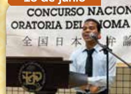
Concurso de Oratoria en Idioma Japonés