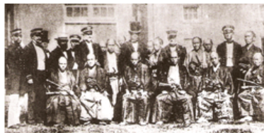
La misión japonesa a Estados Unidos pasó por Panamá en 1860.

Desde entonces, los dos países han desarrollado buenas relaciones a través de intercambios en diversos campos como la economía, la cultura y el deporte.