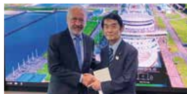
Reunión del Embajador en Misión Especial Imamura con el Honorable Sr. Ricaurte Vázquez, Administrador de la Autoridad del Canal

Como Estado marítimo, Japón mantiene estrechas relaciones con Panamá a través del uso del Canal y del abanderamiento panameño de buques. Son socios que comparten valores fundamentales como los son la democracia, los derechos humanos y el imperio de la ley y se espera una mayor expansión de la cooperación en el ámbito Internacional, especialmente en la ONU donde Panamá será miembro no permanente del Consejo de Seguridad para el periodo 2025-26.