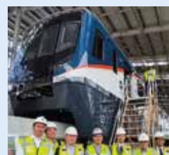
Visita del Presidente de la JICA a las instalaciones ferroviarias

La construcción de la Línea 3 del Metro, financiada por Japón, avanza hacia su inauguración parcial a finales de 2026. Esta línea será la primera de la región centroamericana en utilizar el sistema de monorraíl, y los primeros vagones llegaron a Panamá desde Japón en enero de 2024. A su vez, el Gobierno de Japón a través de JICA, apoya a elaborar planes para estaciones específicas y legislación con el fin de mejorar el acceso a esta línea y promover el uso del Metro.