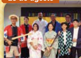
Día de la Cultura Japonesa