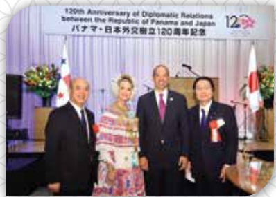
Ceremonia conmemorativa de Japón

Durante ambas ceremonias se intercambiaron mensajes de felicitación entre el Primer Ministro Kishida y el Presidente Cortizo. También se anunció la decisión del Gobierno de Japón de introducir medidas de exención de visado de corta estancia para los titulares de pasaportes ordinarios panameños, a partir de abril 2024.