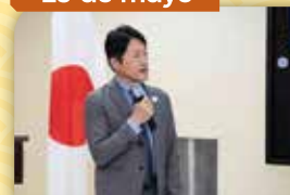
Charla Conmemorativa del 120 aniversario en la UTP por el Embajador Fukushima