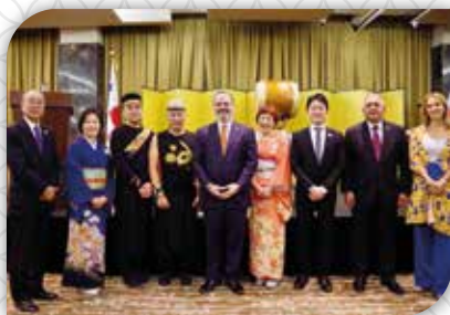
Ceremonia Conmemorativa de Panamá

En enero de 2024 se celebraron en Tokio y en la Ciudad de Panamá los actos conmemorativos del 120 Aniversario del Establecimiento de Relaciones Diplomáticas entre Japón y Panamá.