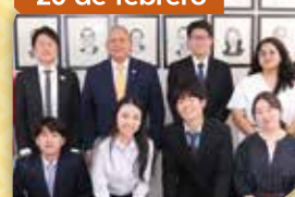
Visita de estudiantes japoneses a Panamá en el marco del programa de intercambio "JUNTOS!!"