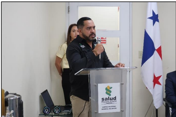
バルネットアントン母子保健センター長による挨拶