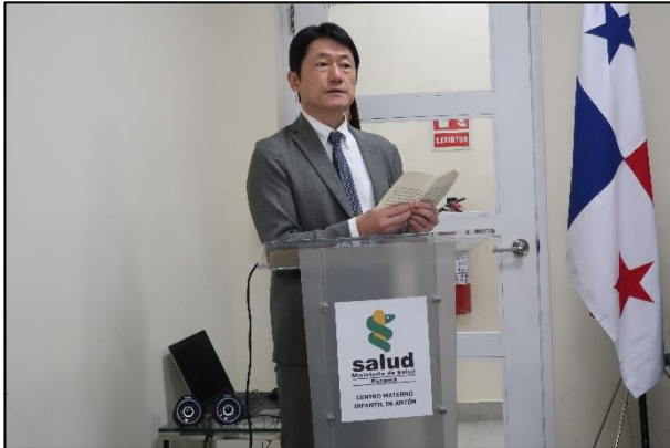
福島大使による挨拶