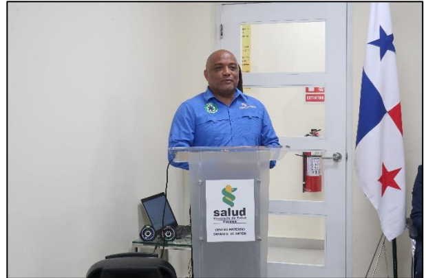
ロサーダ保健省コクレ県保健局長による挨拶