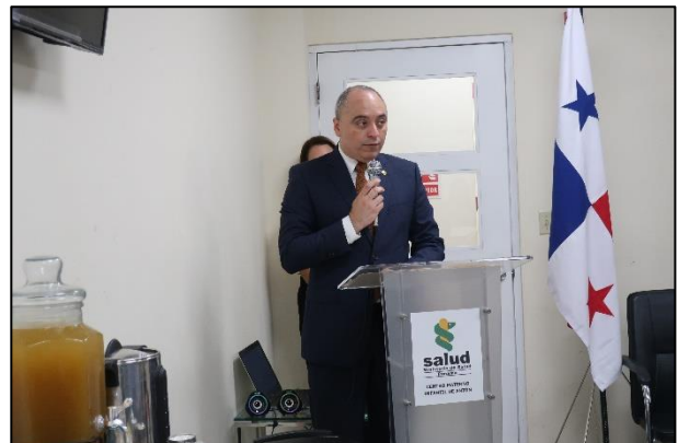
ブロセパナマ市ロータリークラブ・パシフィコ副代表による挨拶