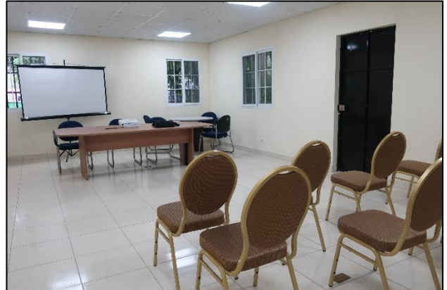
salón de reuniones