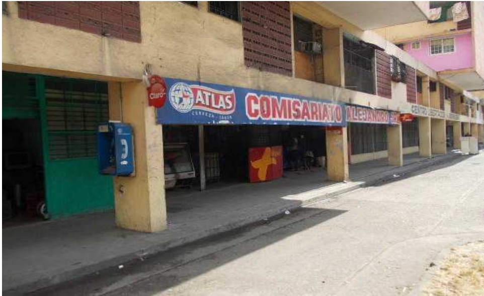
被害現場の状況 (写真中央 雑貨店前通路(歩道)上で発生)