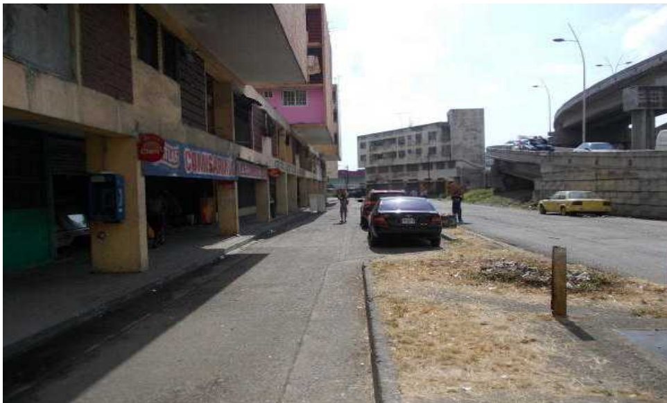
被害現場周辺の状況